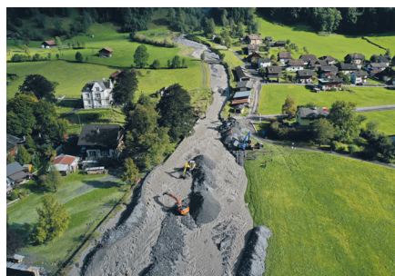
Bagger kämpfen sich durch das Geschiebe