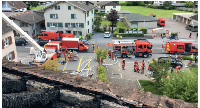
Grossaufgebot der Feuerwehren

Seit Mai haben sich im Glarnerland drei grosse Brände ereignet. Glücklicherweise kamen keine Personen zu Schaden. Die Einsatzkräfte standen jedes Mal mit einem Grossaufgebot im Einsatz. Die Schäden sind beträchtlich und werden die Jahresergebnisse der Versicherung im Monopol und Versicherungen im Wettbewerb stark belasten.