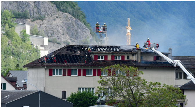
Hubretter im Einsatz bei Dachstockbrand in Netstal