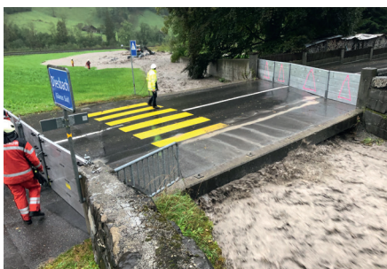
Schutz durch Hochwasserelemente

Schnell war klar, dass für den Aushub des Geschiebes im Bachbett schwere Geräte benötigt werden. Verschiedene Bauunternehmen stellten rasch und unkompliziert Bagger und Maschinisten zur Verfügung. Diese standen in Schichten, teilweise über 24 Stunden lang im Einsatz. Leider gab es sehr viele Schaulustige, welche von den Einsatzkräften zusätzliche Aufmerksamkeit erforderten. «Ohne den Einsatz der Bagger wären grössere Schäden nicht mehr zu verhindern gewesen», so Hanspeter Speich und bedankt sich für die reibungslose Zusammenarbeit mit den Feuerwehren Näfels-Mollis, Glarus und Kärpf und den verschiedenen Organisationen wie Naturgefahrendienst, Bauunternehmen und Partnern. Die der glarnerSach gemeldeten Schäden halten sich in Grenzen.