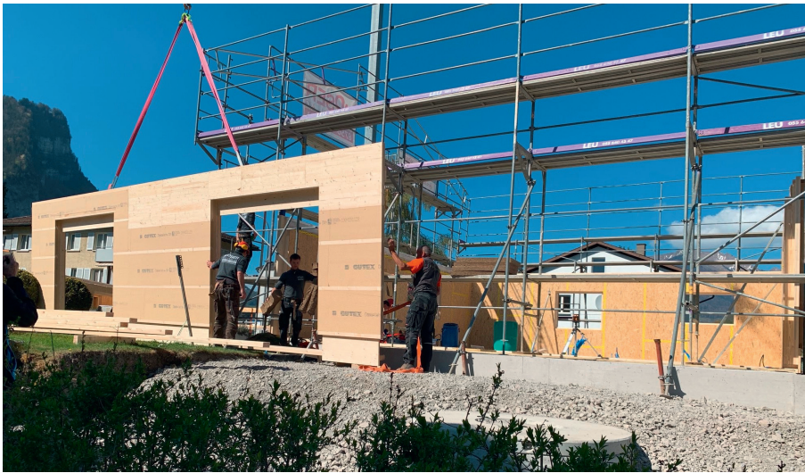
Umfassender Versicherungsschutz während jeder Bauphase

Bei Neubau, Umbau oder Renovation lauern unvorhersehbare Gefahren und bereits ein kleiner Zwischenfall kann das ganze Projekt gefährden. Mit einem angemessenen Versicherungsschutz können unnötige Verzögerungen und nicht budgetierte Rückschläge verhindert werden. Die folgenden Versicherungen empfehlen sich auch, wenn es um kleinere Investitio-