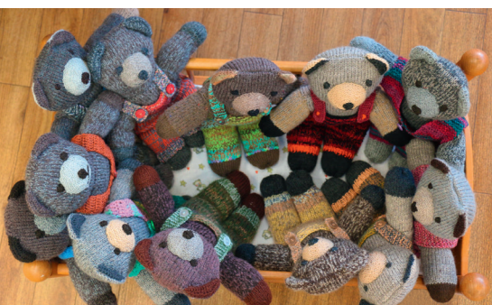
Diese Kuschelbärchen gibt es in der Markthalle

Der Verein Tschernobyl Kinder lädt jedes Jahr rund 40 Kinder aus Tschernobyl für drei Wochen Ferien in die Flumserberge