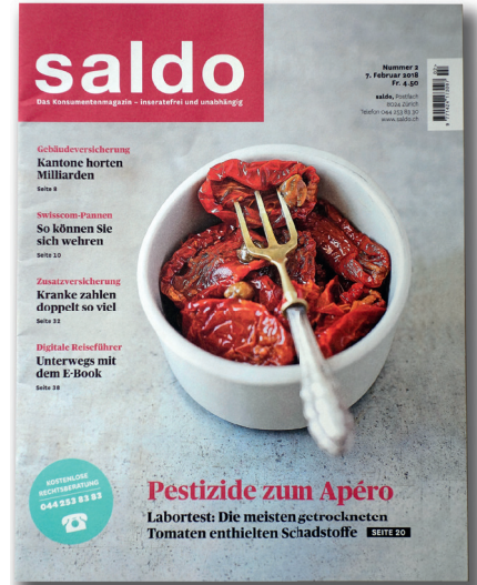
Ausgabe «Saldo» vom 7. Februar 2018

sich auf rund CHF 520 (nicht 665). Die Prämie für ein massives Einfamilienhaus beträgt für diese Versicherungssumme gerade mal CHF 350. Zudem schüttet die glarnerSach regelmässig Prämienrabatte aus. Noch gravierender die Fehlaussagen betreffend Eigenkapital. Das frei verfügbare Eigenkapital beläuft sich lediglich auf gut CHF 28 Mio. (nicht CHF 69 Mio.). Komplett vergessen gehen die versicherungstechnischen Rückstellungen von knapp CHF 84 Mio. sowie die Rückstellungen für Risiken in den Kapitalanlagen von rund CHF 19 Mio. Beide Positionen sind dem Fremdkapital zugeordnet und stehen für Gross- und Katastrophenereignisse bereit. Diese Kombination zwischen Eigen- und Fremdkapital entspricht der vom Verwaltungsrat definierten Sicherheitsstrategie. Wenn schon kritisch, dann bitte korrekt.