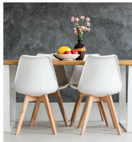
Rundum richtig versichert

Unsere Landwirtschaftsversicherung sichert Ihre Investitionen in Fahrhabe, Maschinen, Fahrzeuge sowie Tiere.