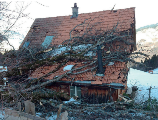
Schaden durch Sturm Burglind

Der Sturm Burglind fegte am 3. Januar mit grosser Kraft und Windgeschwindigkeiten von über 100 km/h durch das Glarnerland. Über 450 Schadenmeldungen an Gebäuden mit CHF 1,5 Mio. Schadenssumme sind alleine aus diesem Ereignis